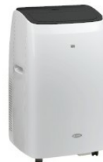
Widok ukośny w lewo