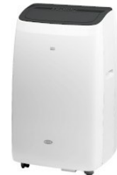
Widok z ukosa w prawo