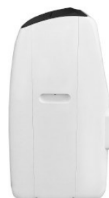
Widok z boku po lewej stronie Widok z boku po prawej stronie