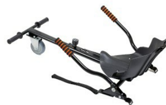
Widok z ukosa z tyłu