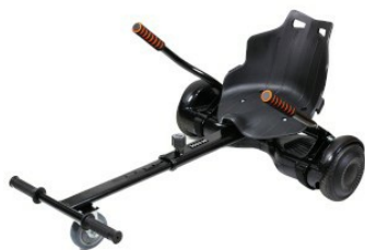
Widok z ukosa