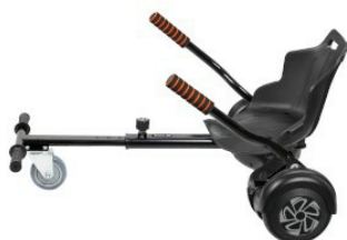
Widok z boku (z Balance Board)