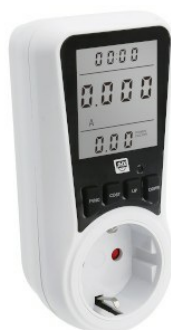
Widok z ukosa