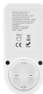
Widok z tyłu