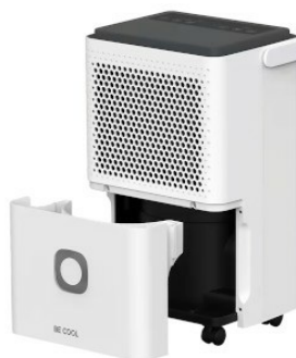
Schrägansicht mit Wassertank