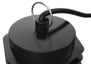
Widok szczegółowy górnego nitu