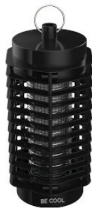
Widok ukośny (wyłączony)