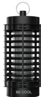
Widok z przodu