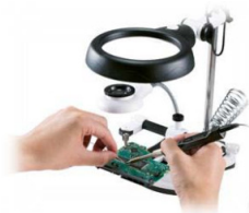
Lassen Sie sich helfen: von der "3. Hand"