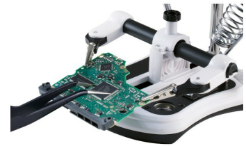
Anwendungsbeispiel 3. Hand