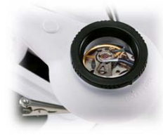
Detaillupe wahlweise mit 5-facher oder 10-facher Vergrößerung