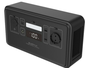
Schrägsicht oben links